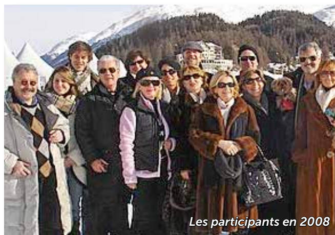
Les participants en 2008

Sans terrain, sans chevaux et sans joueurs, nous avons tout naturellement continué à assister aux matches les plus emblématiques d'Europe comme le Polo World Cup On Snow à Saint Moritz, l'Open de France à Chan-