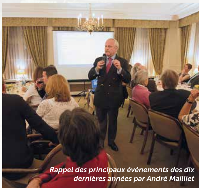
Rappel des principaux événements des dix dernières années par André Mailliet