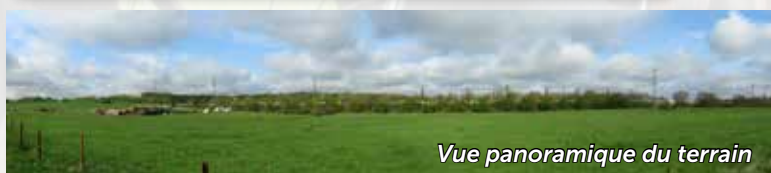
Vue panoramique du terrain