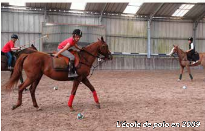
L'école de polo en 2009