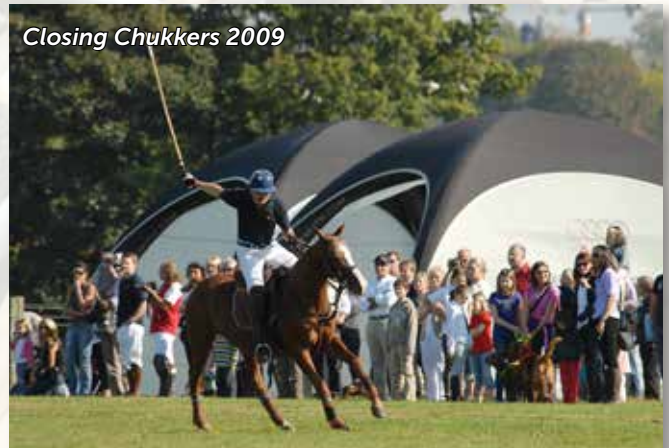
Closing Chuckers 2009

Dans la mesure du possible, des club chuckers furent organisés trois fois par semaine durant toute l'année. La saison d'été 2009 se clôtura le 27 septembre par les désormais traditionnels Closing Chuckers. La pratique du polo ne s'arrêta pas pour autant puis-