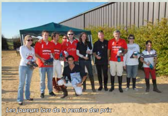
Les joueurs lors de la remise des prix