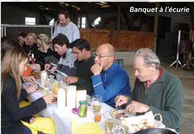
Banquet à l'écurie