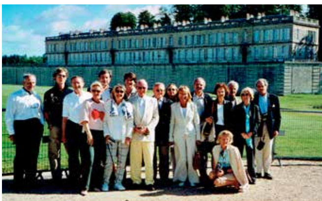
Les membres de la première heure dans les jardins du château de Chantilly