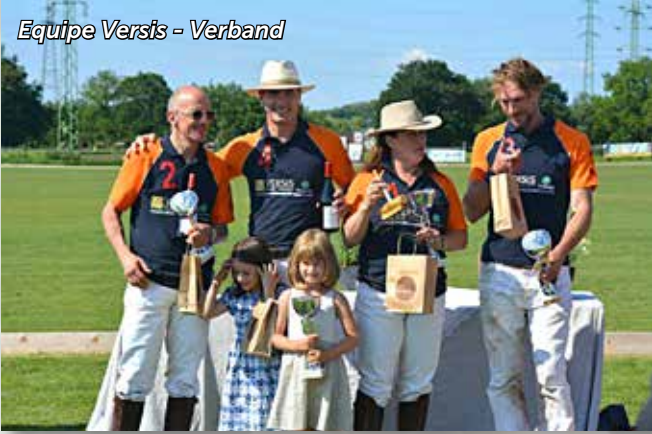
Equipe Versis - Verband

ternational où quatre équipes allemandes et luxembourgeoises se disputèrent les prestigieux prix offerts par nos sponsors. L'événement fut répété en 2014 et devrait s'inscrire désormais dans le calendrier international du polo européen.