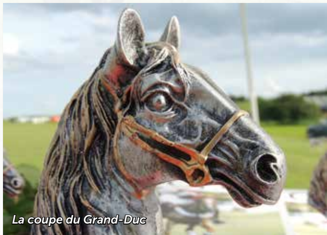
La coupe du Grand-Duc

La Fédération Luxembourgeoise de Polo fut créée