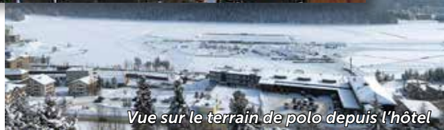
Vue sur le terrain de polo depuis l'hôtel

tilly. Le même week-end, nous avons eu la chance d'être invités par Hermès au prestigieux prix de Diane Hermès à Chantilly. C'est également ici que les premiers de nos membres ont pour la première fois tenu un maillet de polo et tapé leurs premières balles sur des poneys très indulgents.